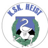
K.S.K. Heist 2e Nationale Antwerpen